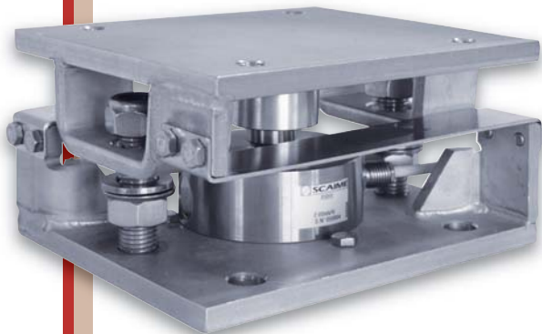
Capteur vendu séparément Load cell sold separately